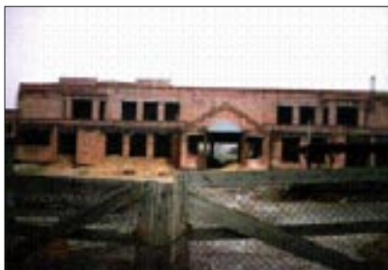
Zdjęcie 8, 9. Budowa nowej szkoły.

Pierwszego września 1995 r. odbyła się uroczysta inauguracja roku szkolnego w nowej szkole. (zdjęcie 11) Oddany do użytku segment mieścił sale lekcyjne uczniów klas IV do VIII. Młodszy uczniowie uczyli się jeszcze w starej szkole. (zdjęcie 10)