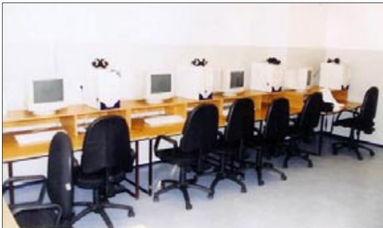
Zdjęcie 23. Pracownia komputerowa.

Za aprobatą zarówno nauczycieli jak i rodziców przyjęto pomysł gromadzenia środków na własną pracownię komputerową. I tak w przeciągu dwu lat, do roku 2002, zgromadzono na koncie szkoły odpowiednie fundusze pochodzące głównie ze środków pozabudżetowych (dochodowych imprez, darowizn, różnego rodzaju przedsięwzięć i składek rodziców na komitet). Realizacja tego zamierzenia była możliwa przy dobrej współpracy z Radą Rodziców. Od 2002 r. ruszyła nowoczesna, 10-stanowiskowa pracownia funkcjonująca w sieci z dostępem do Internetu. (zdjęcie 23). W 2003 r. pracownię przeniesiono do nowego, przestronnego pomieszczenia, a w 2007 r. placówka wzbogaciła się o dalsze 10 stanowisk komputerowych, uzyskanych dzięki pozytywnemu zaopiniowaniu wniosku szkoły, która w 2006 r. przystąpiła do projektu „Pracownie komputerowe dla szkół” ogłoszonego przez Kuratorium Oświaty w Katowicach, a współfinansowanego przez Unię Europejską. Dzięki komputerom i technologii informatycznej możemy tworzyć szereg własnych dokumentów (dyplomy, papier firmowy, kalendarze, zaproszenia, podziękowania, foldery), akcentując odrębność szkoły i budując jej pozytywny wizerunek. Jako jednostka organizacyjna Urzędu Gminy w Gorzycach zamieszczamy najważniejsze informacje w Biuletynie Informacji Publicznej urzędu. Mogliśmy także udostęp-