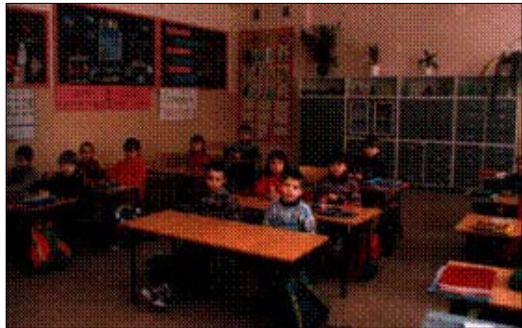
Zdjęcie 13, 14. Klasy w nowej szkole.

Pierwszy segment otwartej szkoły wzbudził zachwyt zarówno uczniów jak i nauczycieli. Piękne, przestronne klasy, duże szerokie korytarze, biblioteka, świetlica, a nawet kafelki w łazienkach – to dla wielu rówieśników naszych uczniów z innych szkół standard, jednak dla turzańskich dzieci był to do tej pory przedmiot marzeń. (zdjęcie 13, 14) W ślad za I segmentem ukończono kolejne: w 1996 r. – segment mieszczący klasy I – III, w 1999 r. – salę