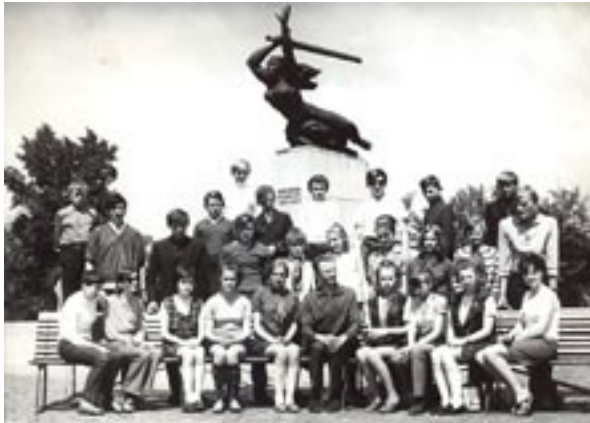
Wycieczka do Warszawy. Rok szkolny 1969/1970