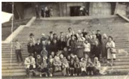
Wycieczka do Planetarium.