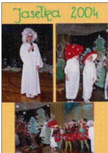
Zdjęcie 18. Jasełka.

Oprócz imprez środowiskowych skierowanych do całej społeczności wsi Turza, nauczyciele organizują uroczystości klasowe typu: Dzień Matki, Babci, Dziadka, spotkania przy choince. Do cie-