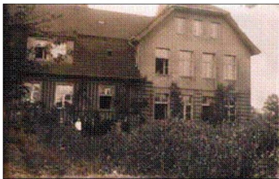
Zdjęcie 1. Szkoła w Turzy około roku 1911.