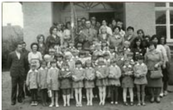
Rok szkolny 1976/77