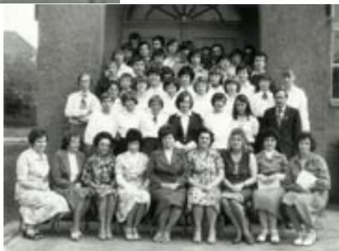
Absolwenci w roku szkolnym 1979/1980