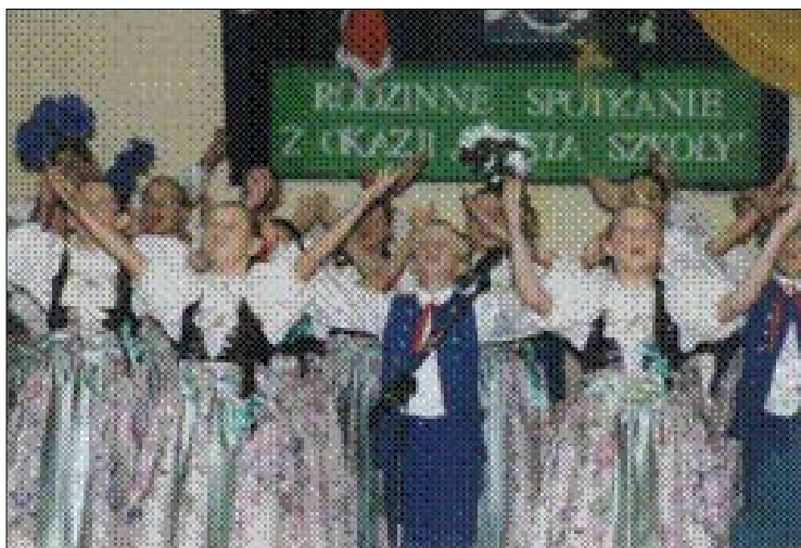
Zdjęcie 19. Biesiada z okazji święta szkoły.