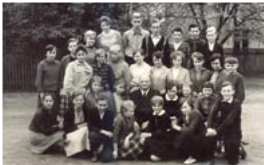
Wychowawca p. Górecki. Rok szkolny 1961/1962